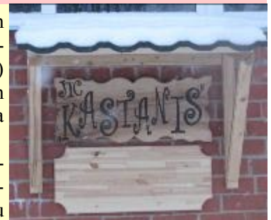
JIC “Kastanis” izkārtne