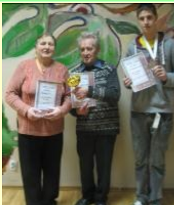
Pieaugušo grupas pārstāvji

tie, kas netika pie medaļām, devās mājās uz pozitīvas nots, jo galvenais jau ir spēles prieks un azarts.