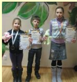
Stiprākie bērnu grupā

Uz turnīru ieradās 23 cilvēki, kas bija negaidīti daudz. Visi dalībnieki dalījās 3 grupās – bērni, jaunieši un pieaugušie. Bērnu, protams, bija visvairāk – 11, kuru vidū bija arī 4 bērni no Maltas. Bērnu konkurencē 1.vietu un